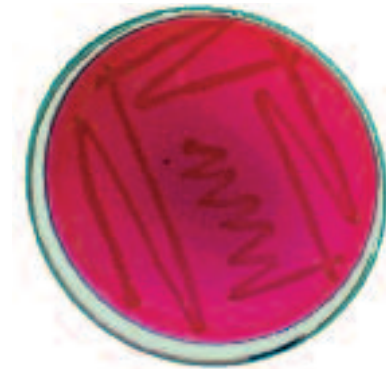
Figura 3b. Salmonella enteritidis incubada en agar verde brillante.