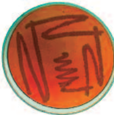
Figura 3c. Salmonella typhi incubada en agar verde brillante.