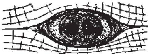
Figura 2. Quiste de Trichinella spiralis .

realice un análisis de laboratorio. Una vez identificado el parásito, el médico recomendará el tratamiento necesario y su seguimiento.