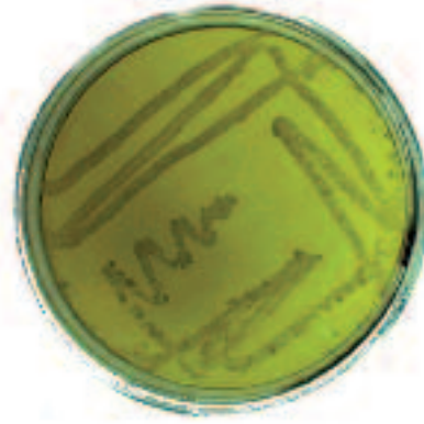
Figura 3a. Salmonella negativo incubada en agar verde brillante.

La mejor forma de prevenir las enfermedades gastrointestinales es practicando una adecuada higiene tanto personal como en la preparación de los alimentos. Mucho se ha hablado de lavarse las manos antes de comer y después de ir al baño, pero eso no es todo: lo principal es conocer la mejor manera de lavarse las manos y el tiempo que debemos invertir en ello: a partir de ese momento ya comenzamos a mejorar nuestra higiene. Se debe poner especial cuidado cuan-