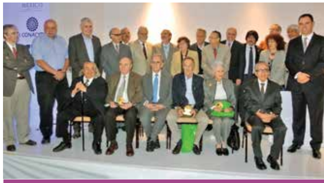
El grupo de científicos galardonados.

“Éste es un esfuerzo importante porque es una plataforma accesible para todos. Si estamos buscando que el conocimiento sea una palanca de desarrollo, es necesario que la sociedad mexicana asu-