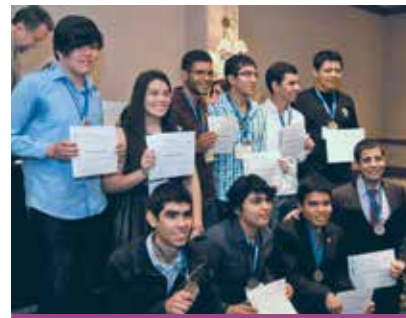
Los triunfadores formarán parte de la selección que representará a México en las competencias internacionales que se realizarán este año en Vietnam y Uruguay.

Con una concurrida y festiva asistencia se realizó el pasado 18 de marzo la ceremonia de premiación de la XXIII Olimpiada Nacional de Química. También se anunció la preselección que representará a nuestro país en las próximas Olimpiadas, Internacional e Iberoamericana, que tendrán lugar este año en Vietnam y Uruguay, respectivamente. Las delegaciones que se convirtieron en las triunfadoras a nivel nacional fueron Chihuahua, con cuatro preseas de oro y una de plata; Jalisco con dos de oro, dos de plata y dos de bronce (2-2-2), Veracruz (2-1-3), Campeche (1-1-2), Yucatán (1-2-1) y Sinaloa (1-2-2). □