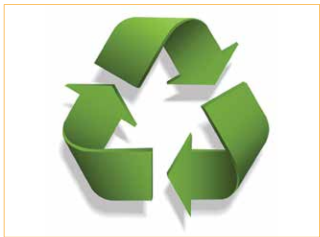
Figura 3. Símbolo internacional del reciclado.

Las tres R de la conservación ambiental son “reducir/reusar/reciclar”. Hacen referencia a reducir la cantidad de desperdicios; reusar aquellos materiales que puedan seguir cumpliendo la misma función, como empaques de líquidos, bolsas de supermercado, etcétera; y reciclar , que implica separar y modificar el material para obtener un producto nuevo. Sin embargo, una etapa esencial es la separación previa de los desechos (sólidos, sanitarios, electrónicos, orgánicos, entre otros). Es importante enfatizar que la gente debe adoptar esta separación como un acto moral y simbólico para el ambiente, ya que, como es bien sabido, la recolección de ciertos materiales como los plásticos no es redituable y por ello cientos de recolectores de basura optan por no separar estos materiales para su reciclaje posterior. Dependiendo de cómo se separan y recolectan, los desperdicios residenciales pueden ser un recurso o un problema. Tanto el papel como el plástico pueden usarse por separado como materia prima, pero no cuando están combinados. También es posible utilizar ambos materiales para producir energía por medio de la incineración. Sin embargo, si residuos orgánicos como restos de alimentos se encuentran en combinación con el papel