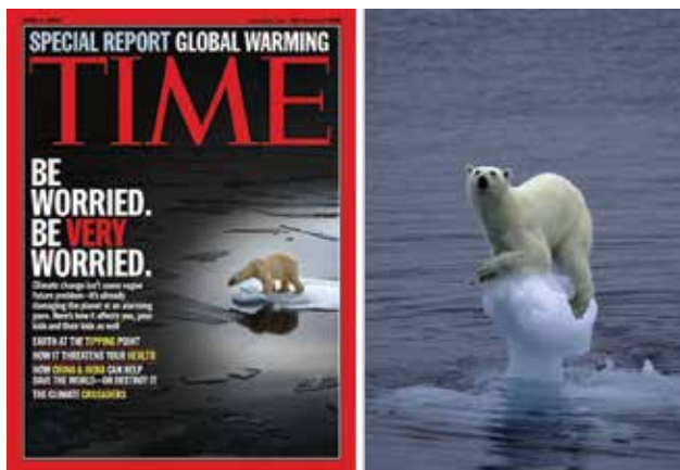
Figura 2. Difusión del riesgo que enfrentan los osos polares por el calentamiento global.