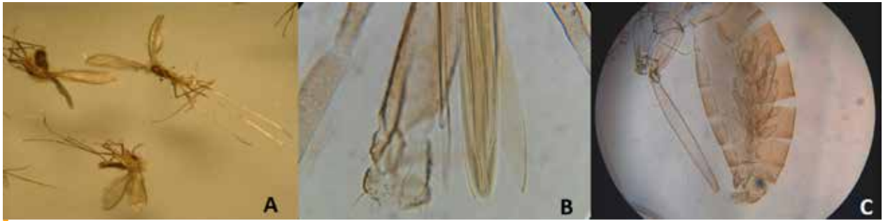
Figura 1. Características del vector Lutzomyia . A) Hembras adultas de Lutzomyia ; B) detalles de las piezas bucales; C) desarrollo de huevos en el interior de la hembra.

una altitud máxima de 2 000 msnm. Hoy se conocen 46 especies de Lutzomyia en México, de las cuales se han identificado 11 especies antropofílicas , pero sólo Lutzomyia olmeca olmeca ha sido comprobada como transmisor del parásito Leishmania mexicana , que causa leishmaniosis cutánea. No obstante, estudios moleculares han demostrado que otras especies de flebotominos, como Lutzomyia cruciata , Lu. panamensis , Lu. shannoni y Lu. ylephiletor están infectadas con Leishmania mexicana .