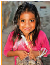
Separador: Jupiter Images.