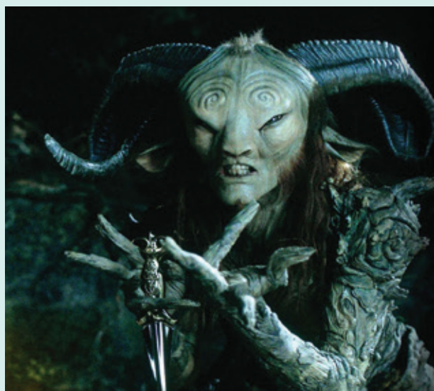
El laberinto del fauno .