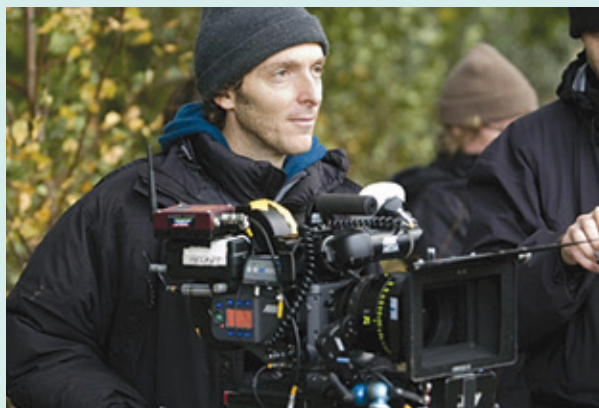
Figura 2. Emmanuel “El Chivo” Lubezki, cinefotógrafo mexicano.

Destacado fotógrafo a nivel internacional. Su cinefotografía se destaca por la diversidad de registros y versatilidad. Su trabajo es ejemplo de que la fotografía puede hacer reír, reconstruir una época, crear un mundo fantástico, conmover y, en suma, contar las historias como sólo el cine puede hacerlo.