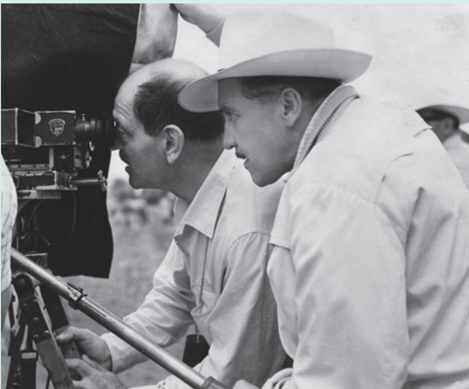
Luis Buñuel y Gabriel Figueroa.