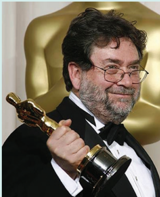
Figura 3. Guillermo Navarro, ganador del Óscar por el filme El laberinto del fauno .