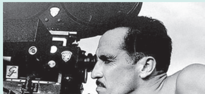
Figura 1. Gabriel Figueroa, cinefotógrafo.