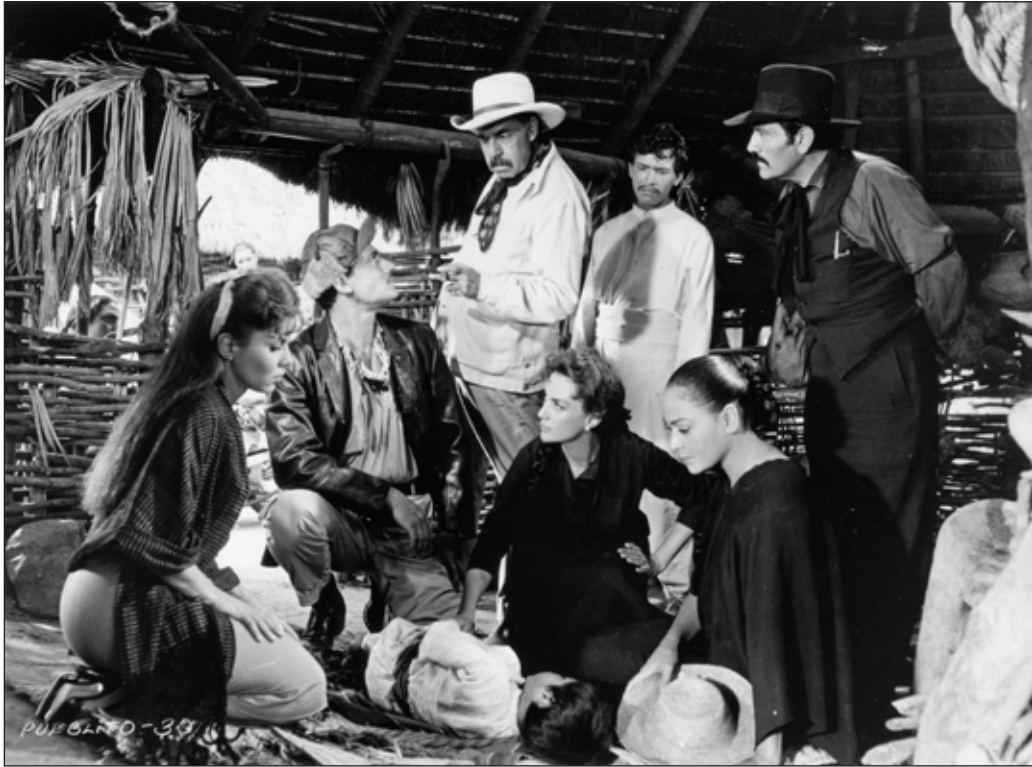
Lilia Prado, Fernando Soler, María Elena Márquez y Columba Domínguez en Pueblito (1961). Director: Emilio "El Indio" Fernández.