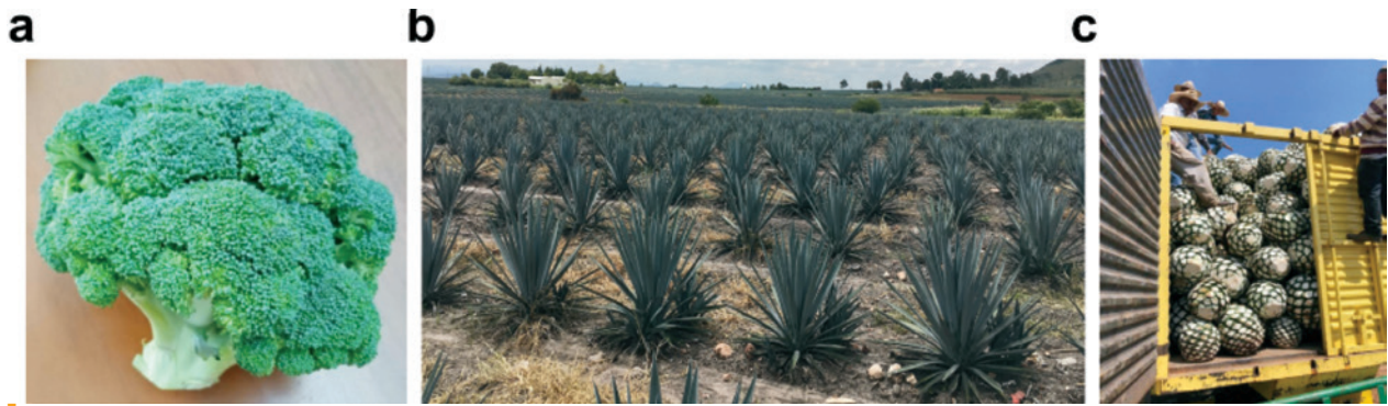
Figura 1. El brócoli y el agave son dos plantas de importancia agrícola y comercial para el estado de Guanajuato. a) El brócoli lo podemos encontrar en las tiendas tradicionales como producto fresco, pero también se comercializa congelado o procesado. El florete está formado por inflorescencias de diversos tamaños. Las inflorescencias están sostenidas por pedúnculos y éstos a su vez por el tallo. b-c) A partir de la piña del Agave spp. se elaboran bebidas como el tequila y mezcal. Foto tomada en un sembradío de agaves en Pénjamo Guanajuato.

el establecimiento de diversas tequileras y mezcaleras dentro de Guanajuato. Desafortunadamente, no todo el brócoli que procesan las empresas, o que se comercializa en los mercados, ni toda la planta completa de Agave spp. se aprovechan. No obstante que dichos subproductos agrícolas son una fuente importante de compuestos bioactivos que pueden ayudar a la salud, o servir como alimento para consumo animal, pudiendo generar ingresos extras y ayudando a disminuir parte de la contaminación que ocasionan. Se estima que el 45% de los vegetales y frutas que se cosechan a nivel mundial son desperdiciadas y que un tercio de la comida que se produce para consumo humano (casi 1 300 millones de toneladas) termina en los basureros o vertederos (Naciones Unidas, 2018). Aun cuando la cantidad y tipo de desechos vegetales que se generan en México y a nivel mundial es inmensa, en este trabajo nos enfocaremos en contestar la pregunta: ¿si vale la pena aprovechar los subproductos de brócoli y las hojas de agave?; lo anterior debido a que son dos de los subproductos que más se generan en el estado de Guanajuato.